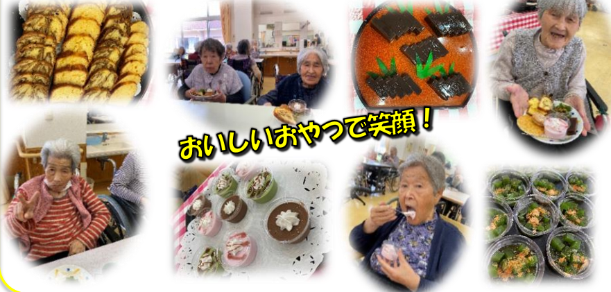
おいしいおやつで笑顔!

5月16日、午後のおやつのおやつバイキングを開催しました。今回も前回に引き続きオードブル形式での提供となりました。どの種類も少し小さめに沢山の種類を食べられるよう工夫を凝らしています。「どれにしよう!」「ケーキちょうだい!」などと声も飛び交い、悩みながらも色々な種類のおやつをお皿に盛り、満足いくまで召し上がられていました。「甘いのが最高だね!」「いや～お腹いっぱいだ」と喜びの声も聞かれました。