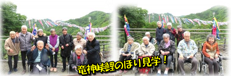
竜神峡鯉のぼり見学!

5月9日、大型バスで「竜神峡鯉のぼり」見学に行ってきました。久しぶりの遠出となり、皆様とても楽しみにしていました。当園を出発すると、山々の新緑や紫色の藤の花が見られ「綺麗ね」と会話も弾んでいました。到着後、大吊橋が見える場所へ移動し、渓谷に多くの鯉のぼりが群舞する姿を見て「こんなにたくさんの鯉のぼりを見たのは初めて!!何匹いるんだろう?」「素晴らしい景色ね」と驚きや喜びの声が上がっていました。最後に鯉のぼりをバックに記念撮影をして思い出のひとつが増えました。 18日には本館ホールにてミニ運動会を開催しました。本館、新館対抗ゲームを4種目を行い、皆様夢中になって競い合いました「皆で体を動かす事が出来て楽しかった」と話されていました。