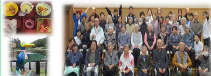
鶴の岬会食ツアー!

5月に入り、窓の外は当園の山肌につつじの花が満開になりました。デイサービスでは、花紙で紫陽花を作って季節の移り変わりを感じていただいています。 また、5月には母の日がありました。生花のカーネーションを皆様にプレゼントし、小さい頃のお母さんとの思い出を語っていただきました。 そして、毎年恒例行事となっている『鶴の岬会食ツアー』では、たくさんの方々に参加していただき、会食後の余興も大変に盛り上がり、楽しい時間を過ごすことができました。 そのほか、職員手作りのお好み焼き、クリームあんみつ、ピザ等を別日に行い、美味しく味わっていただきました。