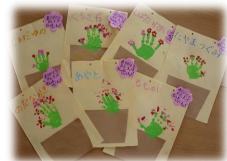
<ベビーキッズ・修了式の様子>