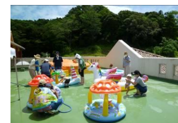
プール開きました♪