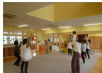
ふれあいあそび 大好き♡