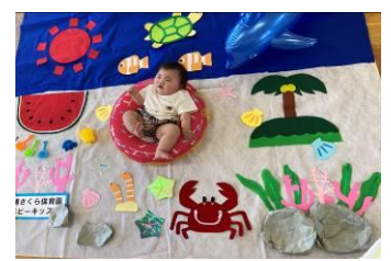
寝相アート 夏バージョン