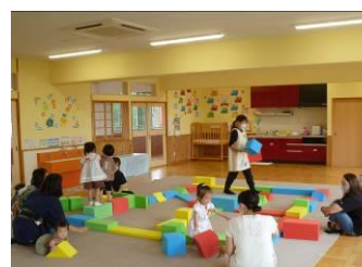
雨の日でも、お部屋で元気いっぱい！ みんなで線路を作って遊んだよ！